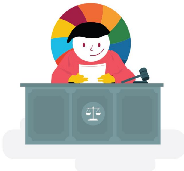
Imagen de justicia abierta