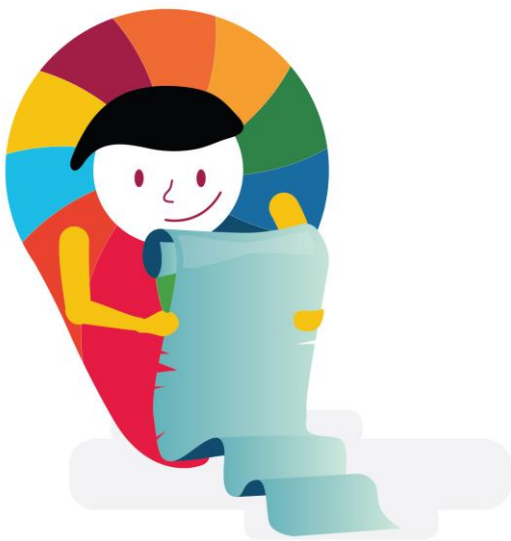
Imagen de marco normativo

La Ley General de Transparencia y Acceso a la Información Pública, publicada en 2015, refiere específicamente al gobierno abierto en su capítulo III. En esta norma se confiere a los organismos garantes de la transparencia y el acceso a la información la responsabilidad de apoyar a las instituciones públicas y a la sociedad civil para implementar mecanismos de colaboración para promocionar, implementar y evaluar las acciones de apertura gubernamental. Al tratarse de una ley de carácter general las legislaciones de los estados deben observar y respetar los mínimos establecidos en ella. Además, existen otras normas que fundamentan el modelo de gestión del gobierno abierto desde la óptica de la administración pública.