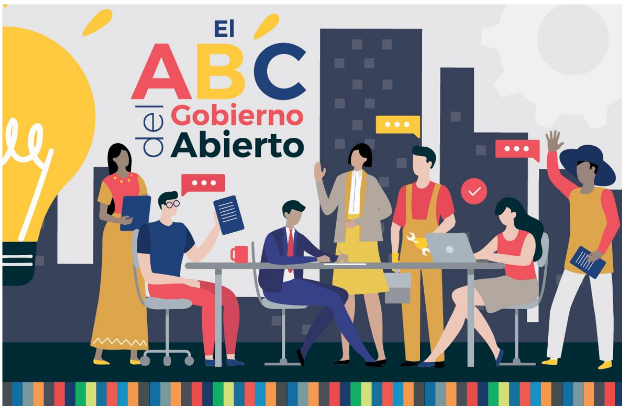
Imagen de portada