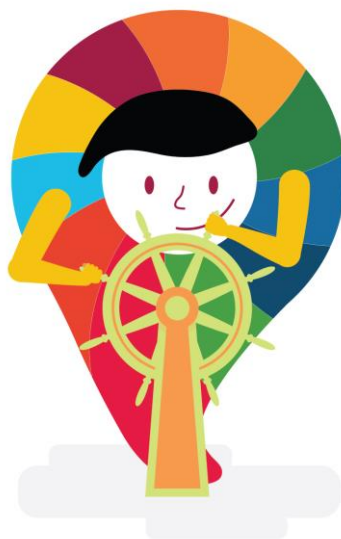
Imagen de Coordinación

En México se optó por incluir también a los organismos garantes del derecho de acceso a la información, ello se conoce como modelo tripartita que busca refrendar una representación equilibrada en la toma de decisiones.