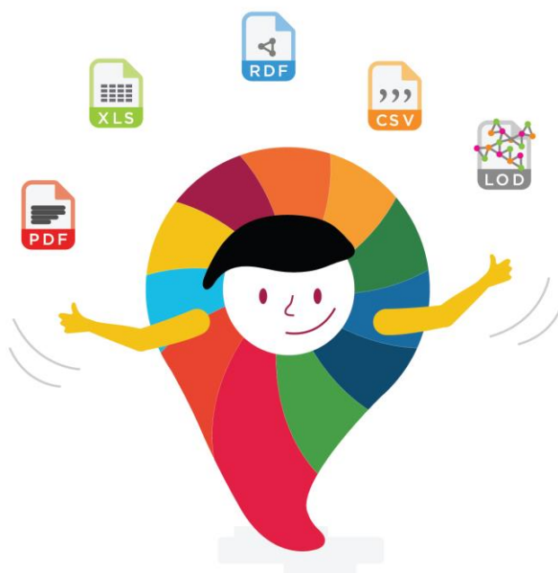
Imagen de datos abiertos y gobierno abierto

El término datos abiertos se refiere a aquella información sistematizada en bases de datos estructuradas de tal forma que puede ser fácilmente compartida, reutilizada y moldeada a otros propósitos con un mínimo esfuerzo y un costo reducido o nulo. Los datos abiertos, en particular los de naturaleza gubernamental son un importante recurso que puede ser aprovechado por los ciudadanos para múltiples fines, tales como la creación de empleos, generación de cadenas de valor, crecimiento económico, desarrollo de aplicaciones electrónicas, investigación e innovación entre muchas otras.