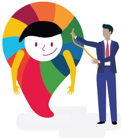
Imagen de medición de la apertura