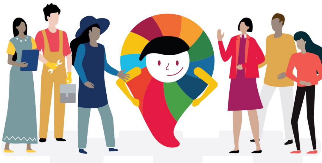
Imagen de gobierno desde lo local

Es la estrategia que traslada el modelo de gobierno abierto a los estados, municipios y alcaldías, en donde ocurre la mayor parte de interacciones entre la ciudadanía y sus gobiernos. Significa abordar problemáticas comunes tales como seguridad pública, atención a parques y calles, abastecimiento de agua, recolección de basura, por mencionar algunos. Además, involucra a los habitantes de la comunidad y considera sus prioridades e ideas para encontrar soluciones a los problemas públicos.