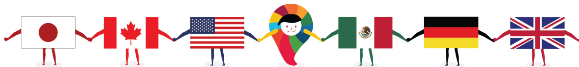
Imagen sobre Alianza

La Alianza para el Gobierno Abierto (AGA) es un esfuerzo a nivel global para facilitar la implementación de prácticas de apertura en el ejercicio gubernamental a través de la formulación de compromisos concretos para promover objetivos definidos de forma conjunta entre sociedad y gobierno, establecidos en lapsos bianuales y bajo el escrutinio de la sociedad civil.