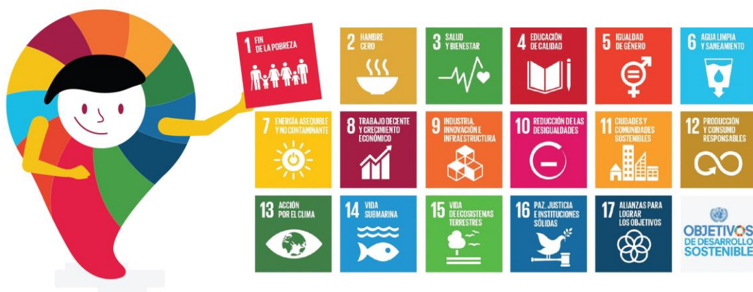
Imagen de gobierno abierto y los objetivos

Si bien el gobierno abierto es un paradigma que se dispone para alcanzar cada uno de los objetivos, destaca su papel en el objetivo: “16º Paz, justicia e instituciones sólidas”. Este se propone configurar un nuevo marco de gobernanza pública y un renovado funcionamiento estatal que permita promover sociedades pacíficas e inclusivas para el desarrollo sostenible, facilitar el acceso a la justicia para todos y construir instituciones eficaces, responsables e inclusivas que rindan cuentas en todos los niveles. En virtud de ello, se ha aceptado al objetivo 16º como una meta transversal para lograr con éxito el resto de los objetivos.