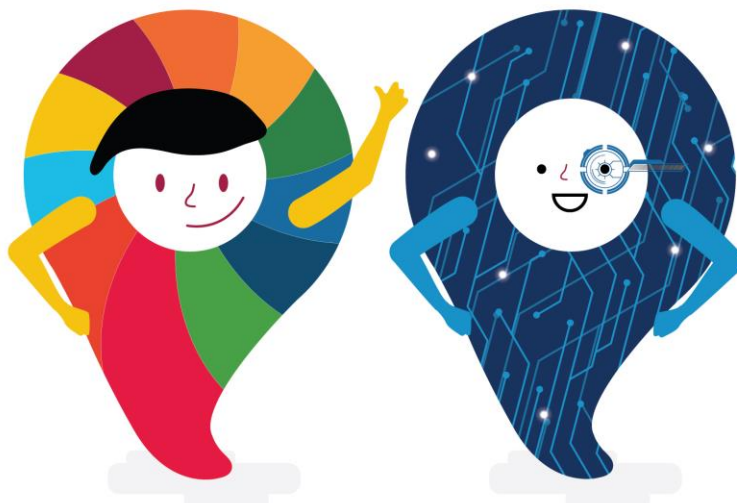
Imagen de diferencia entre gobierno abierto y gobierno electrónico

El gobierno electrónico utiliza la tecnología, para mejorar cualitativamente los servicios e información que se ofrecen a los ciudadanos, se enfoca a la voluntad y la capacidad del gobierno para utilizar la tecnología para llevar a cabo sus funciones con mayor eficiencia. Constituye una herramienta para facilitar la provisión de bienes públicos al alcanzar a un mayor número de personas.