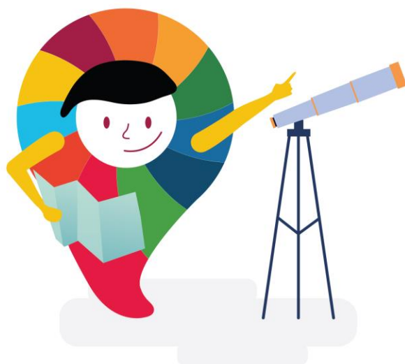
Imagen de plan de acción

tiempos de ejecución, los avances en el cumplimiento de los compromisos y el modo en que se evalúan los resultados.