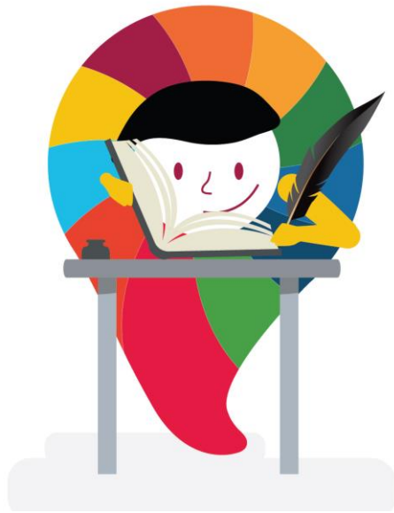
Imagen de congreso y parlamento abierto