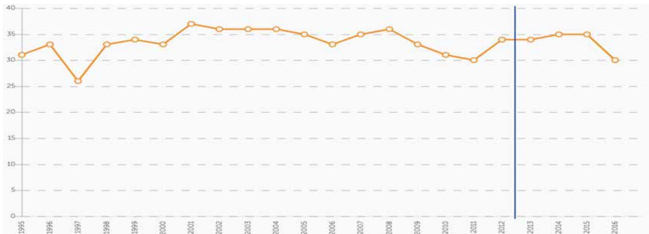
Gráfica 1. Evolución del Índice de Percepción de la Corrupción en México